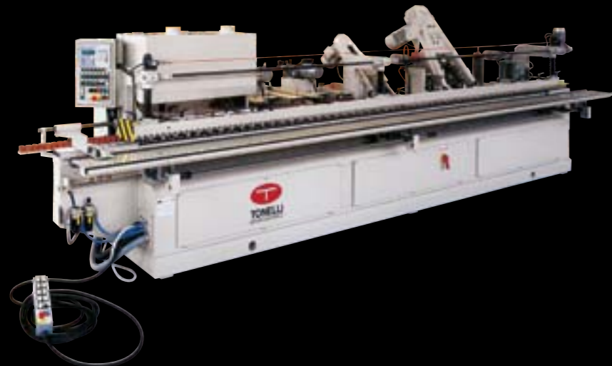
Macchina levigatrice versione monolato.